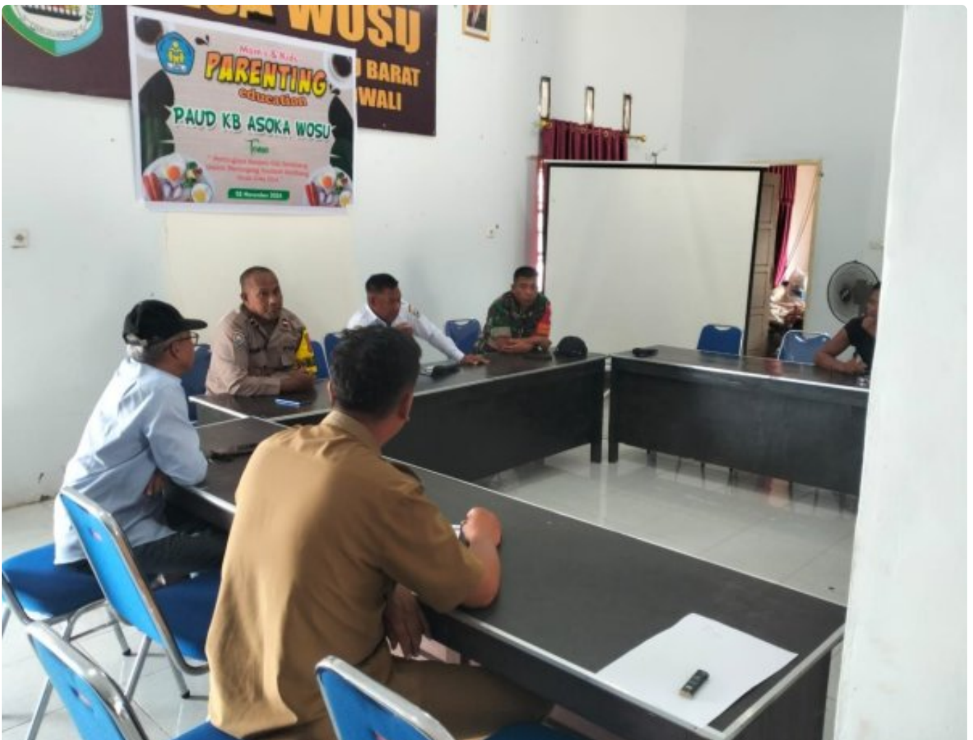
Tampak mediasi dari Polsek Bungku Barat

MOROWALI, Sulawesi Tengah- Bertempat di Kantor Desa Wosu, Kecamatan Bungku Barat, diadakan pertemuan untuk menyelesaikan perselisihan kepemilikan tanah yang melibatkan warga setempat. Acara ini dihadiri oleh unsur